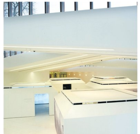
Een impressie van de nieuwe ondergrondse tentoonstellingsruimte van het Drents Museum, met vanaf linksboven met de klok mee een van de witte wenteltrappen, de entree, een van de witte zuilen in de ruimte en een van de ramen waar daglicht doorheen valt.