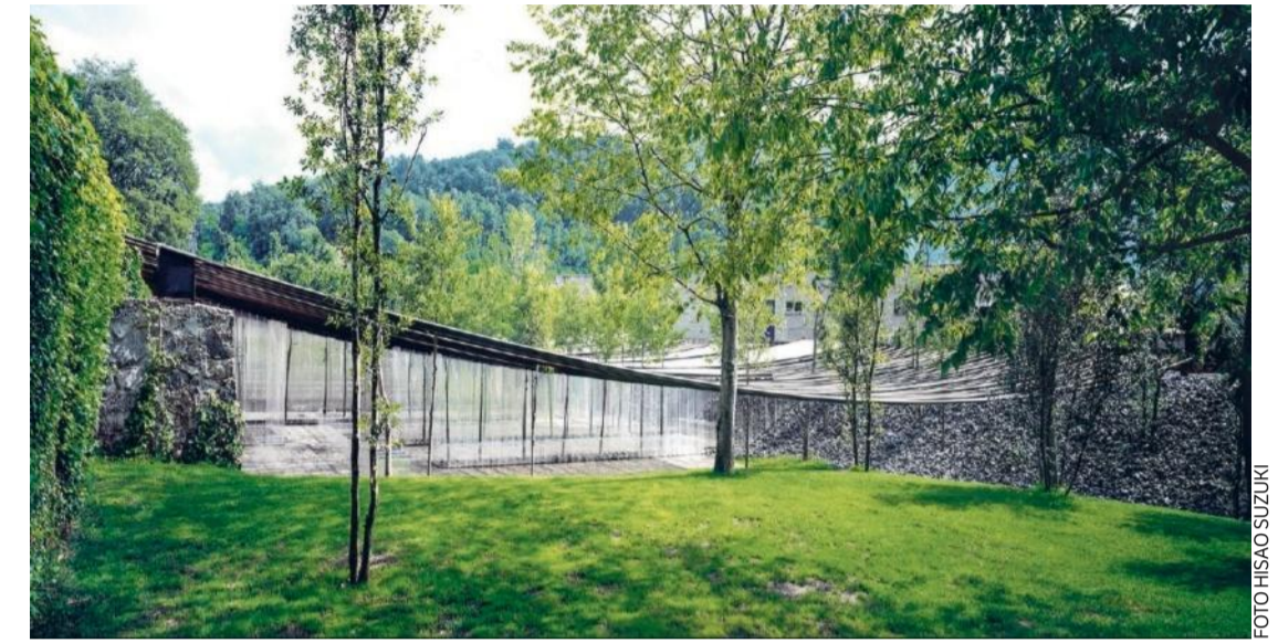
Restaurant Les Cols in Olot, Girona